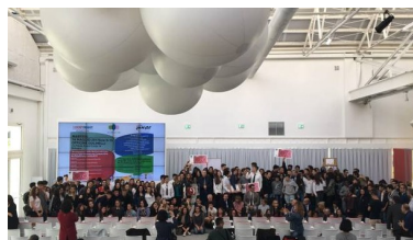
Opificio Golinelli, premiazione delle scuole da parte di Legacoop e Confcooperative